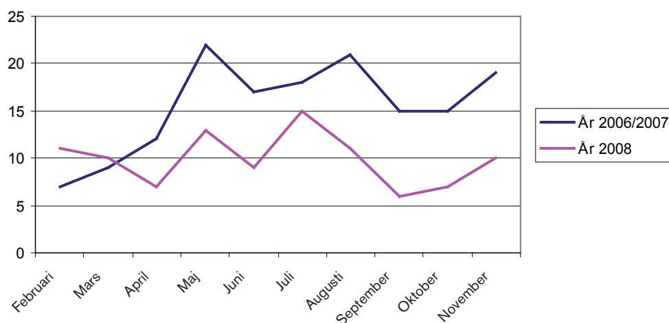
Figur 1. Figur över våld bland unga i Sundsvall räknat utifrån ett genomsnitt för månaderna februari till november år 2006 och år 2007, jämfört med motsvarande månader år 2008.

Jämförelsen visar att det skett en minskning till år 2008 jämfört med genomsnittet av år 2006 och år 2007. Jämförelsen visar också att våldsbrottligheten bland unga låg lägre under nästan alla månader år 2008 jämfört med genomsnittet för åren 2006 och 2007. Endast under februari och mars år 2008 anmäldes fler våldsbrott. Utöver det är mönstret ganska likartat med en topp i maj och i slutet av sommaren, vid båda mätningarna och stigande antal anmälningar under november.