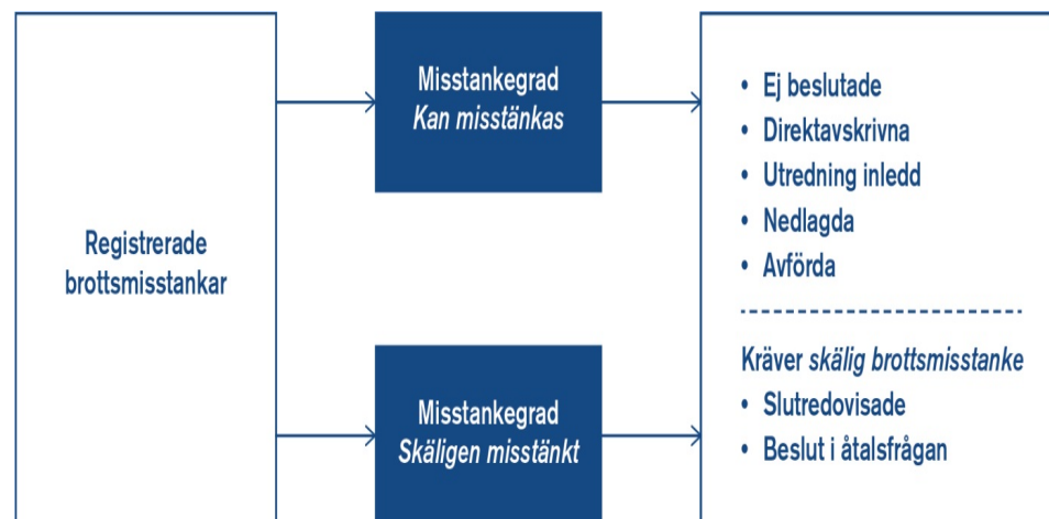
Figur 2. Olika beslut som registrerade brottsmisstankar kan få.