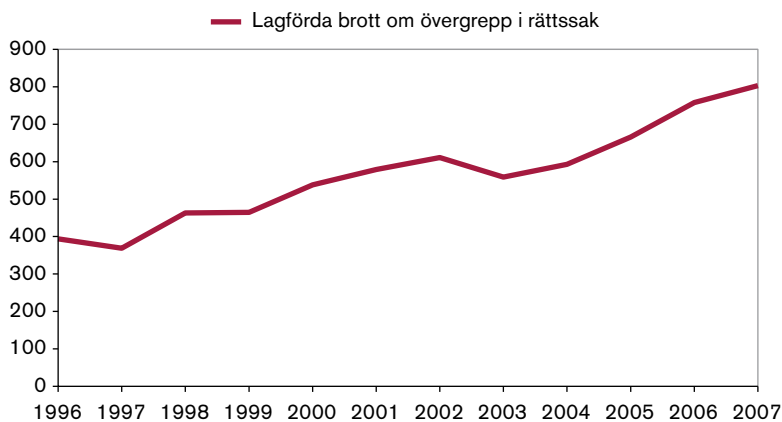
Figur 2. Antal lagförda brott för övergrepp i rättssak, inklusive grovt brott, åren 1996–2007.

Liksom för anmälningstatistiken är det svårt att bedöma om ökningen av lagföringar beror på en faktisk ökning av antal brott eller på