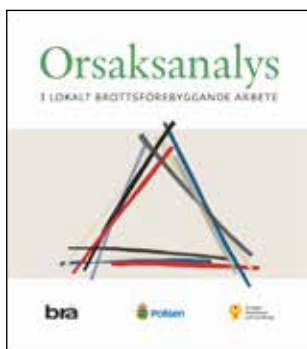
Orsaksanalys i lokalt brottsförebyggande arbete. Handbok. Stockholm: Brottsförebyggande rådet (2018).