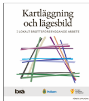
Kartläggning och lägesbild (1:a uppl.) Handbok. Stockholm: Brottsförebyggande rådet (2021).