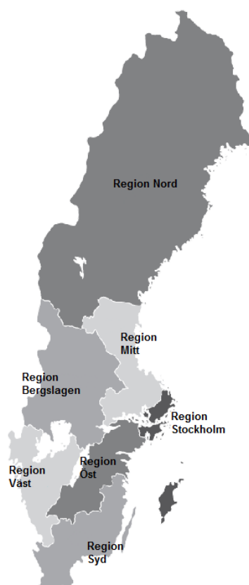
Figur 2. Regionindelning.

Region Nord består av Region Jämtland Härjedalen, Region Norrbotten, Region Västerbotten och Region Västernorrland.