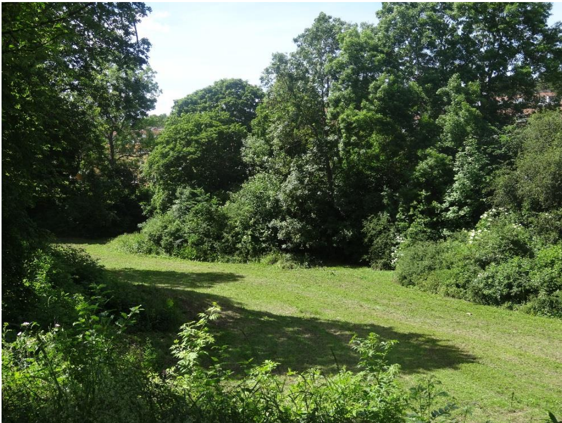
"Ravinen" är exempel på den stora tillgången på grönområden i Vårby.

Utvärderingen har hittills argumenterat för att projektdeltagarnas engagemang i och upprustning av Vårbys utemiljö har flera (för projektets målbild) önskvärda främjande och (brotts)förebyggande konsekvenser på individ- och gruppnivå. I detta avsnitt vänds blicken mot två trygghetsskapande faktorer som enligt invånare kan kopplas till Tillsammans för Vårby . För det första åskådliggörs hur fysiska förändringar i området har minskat den upplevda sårbarheten och för det andra hur mänskliga möten mellan deltagare och boende bryter anonymiteten över generationsgränserna. En central utgångspunkt är att all trygghet är att betrakta som upplevd trygghet ; det är vad människor upplever som verkligt som får verkliga konsekvenser för hur de organiserar sina dagliga aktiviteter. Följaktligen är det också väsentligt att initialt understryka att de allra flesta informanterna inte upplever Vårby som en otrygg plats att växa upp och bo på. Under fältarbetet utkristalliseras en trygghetsbild som i mångt och mycket är spatial och situationellt betingad; i synnerhet är vissa platser under vissa tider på dygnet och delar av året förenade med en upplevd sårbarhet, som kan kopplas till en oro att utsättas för brott särskilt bland kvinnor och äldre orsbor.